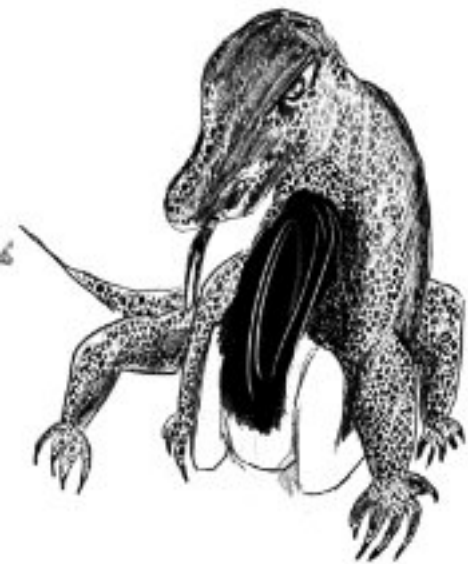
Illustratie Gert-Jan van den Bemd